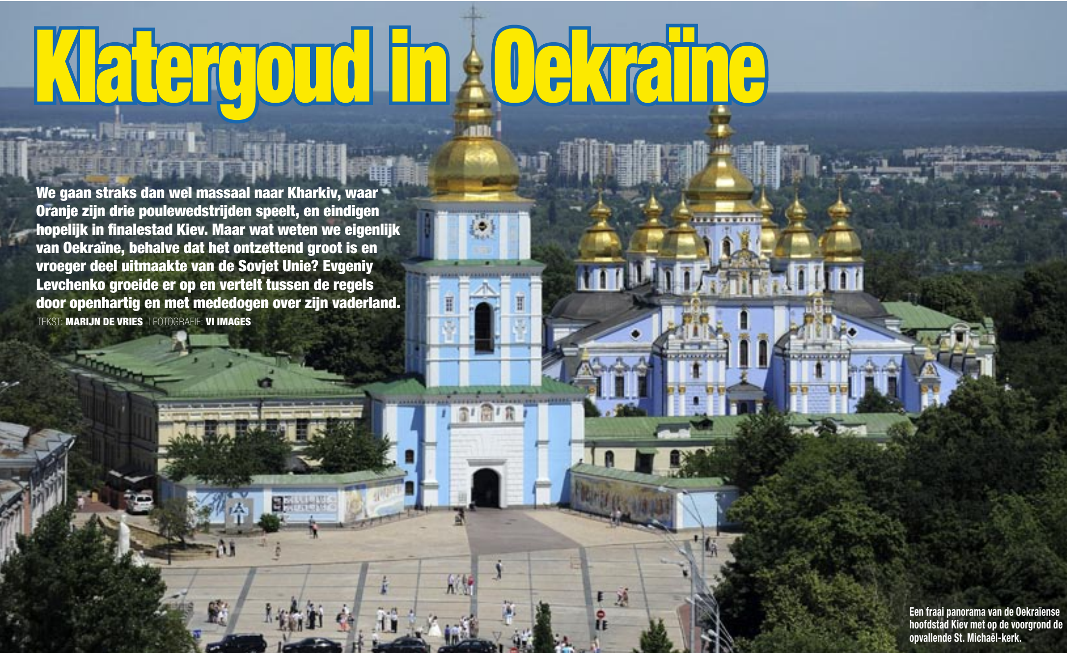
Een fraai panorama van de Oekraïense hoofdstad Kiev met op de voorgrond de opvallende St. Michaël-kerk.

TEKST: MARIJN DE VRIES